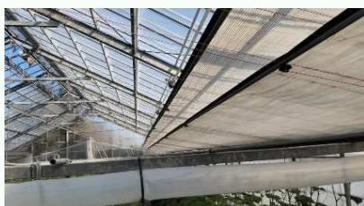
← 研究農場 きゅうり栽培ハウス