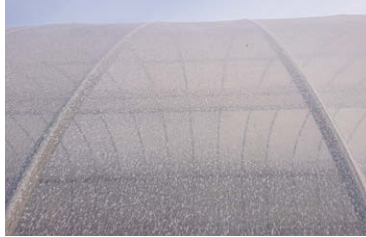
吹き付け後のフィルム表面