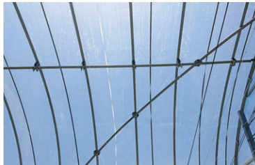
吹き付け前(ハウス内)