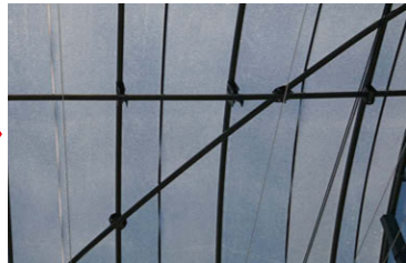
吹き付け後(ハウス内)