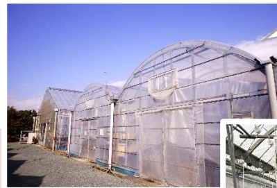
TSKの2連棟ハウスです