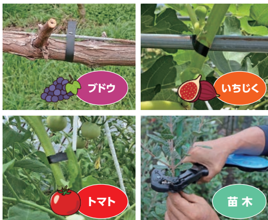
果樹の棚栽培、苗木を始め、様々な作物や栽培方法に対応。

専用のテープ・ステープルの組み合わせにより 反発力の強い枝もしっかりと結束します。