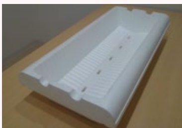
プランターあたり8株定植で、株あたり2.8Lの充実した培地量