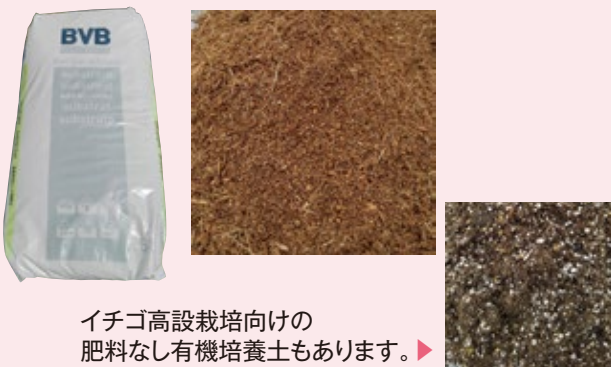
イチゴ高設栽培向けの肥料なし有機培養土もあります。▶