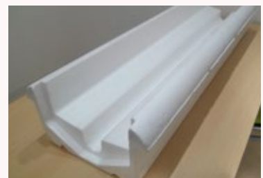
湛水ができるため、ロックウール培地の使用も可能