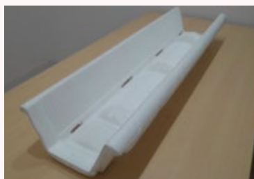
栽培ベッドに排水孔があり、排水性が良い