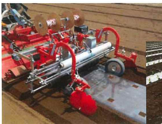
トラクター用：同時穴あけシーダーマルチャー（2条）