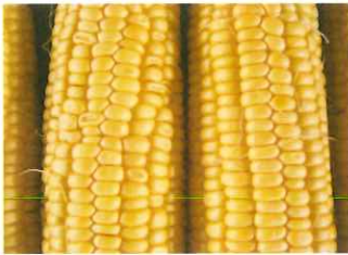
高冷地・8月下旬収穫 収穫後4日目に皮をむいた状態 左：「ゴールドラッシュ」 右：「ゴールドラッシュ86」