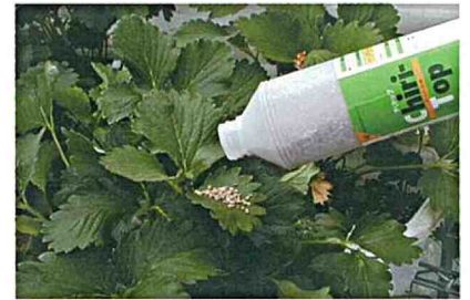
チリトップ導入例