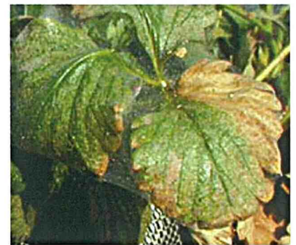
ナミハダニによる被害