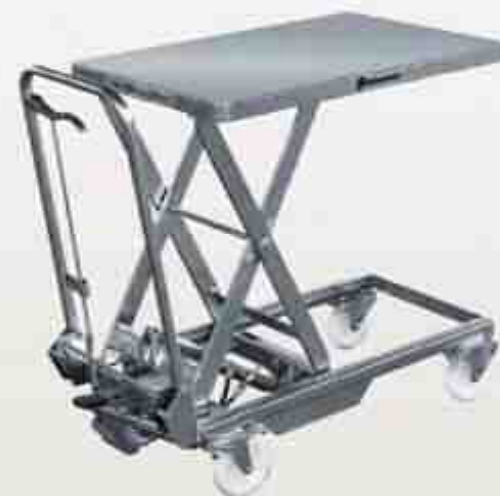
ステンレスタイプ