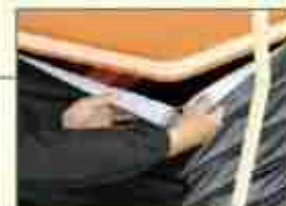
マジックテープで後付け簡単

リフトの伸縮部分に人や物が入り難くする為の安全装置です。マジックテープを使用して取付ける事ができる為、納入後でも取付け可能です!