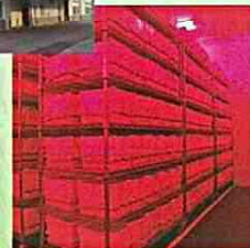
マルハナバチ飼育室